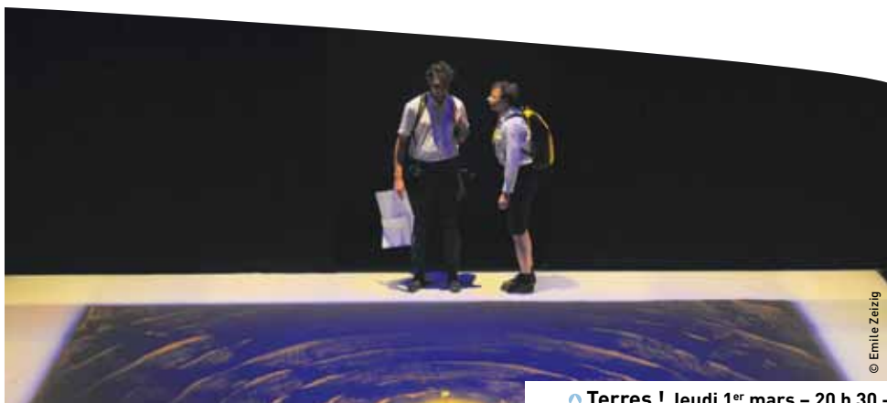
Terres ! Jeudi 1 er mars – 20 h 30 – Théâtre municipal – Mende

« Nous travaillons avec Scènes Croisées depuis plus de 10 ans. Le partenariat s'est noué tout naturellement, car nous avons la même vision artistique, qui passe notamment par la défense de l'écriture contemporaine. On met nos efforts en commun, cela permet d'enrichir la programmation, et surtout de donner un espace d'expression à des artistes actuels, ici en Lozère. C'est payant : on a façonné une identité reconnue sur la région entière, notre public est fidèle et s'est élargi.