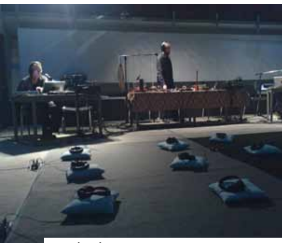
♣ Les Instants sonores, du 8 au 17 juin 2012

La Scène conventionnée de Lozère présente une spécificité de taille : ne pas disposer de salle de spectacle. Une variable contraignante, en terme de coût et surtout de logistique. Un fonctionnement atypique, certes. Mais l'association contourne la difficulté, en s'appuyant sur une vingtaine de partenaires locaux : une série de soirées itinérantes est programmée, et des bus gratuits sont mis en place pour certaines représentations. Grâce à Scènes Croisées et au Conseil général, les rendez-vous culturels rythment l'année lozérienne. ■