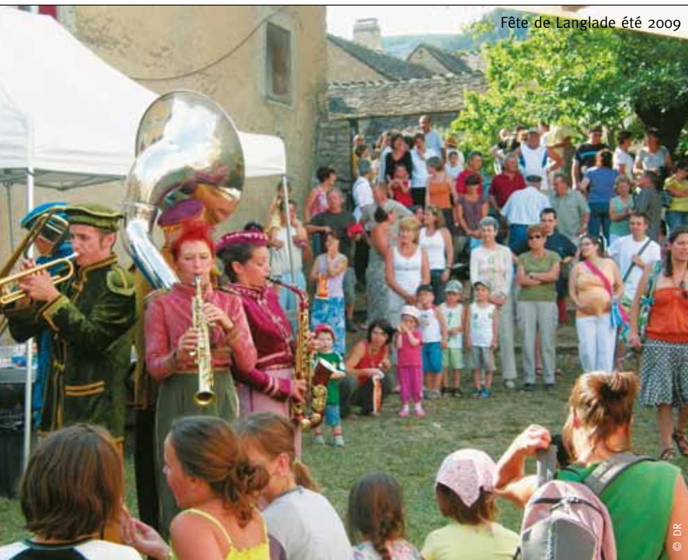
Fête de Langlade été 2009