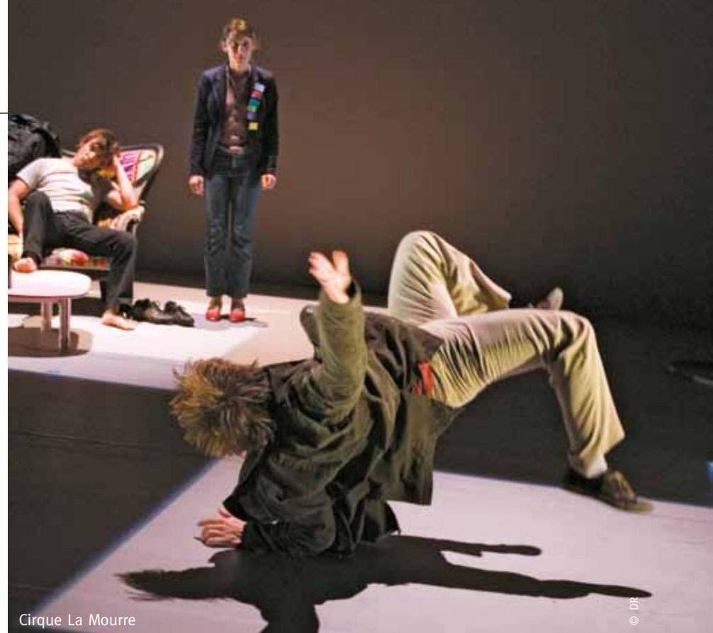
Cirque La Mourre

dans le travail de la compagnie et dans le choix des auteurs, il s'agit d'une véritable démarche artistique avec ce qu'elle contient d'exigence. Dès lors l'aide du Conseil général et l'accompagnement de l'Adda-Scènes Croisées nous permet de programmer plus facilement ce type de spectacles. Les échanges sont permanents entre nos structures ; nous partageons nos points de vue sur les spectacles afin d'élaborer une saison qui mêle théâtre, musique, danse et cirque. » « En outre, explique Thierry Arnal, il y a pour nous une volonté de reserrer les liens entre artistes et public. Chaque année, nous accueillons sur la commune une compagnie en résidence afin de multiplier des temps de rencontre. »