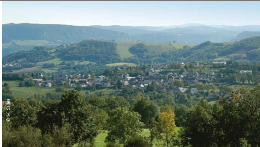
Saint-Germain du Teil

Quant aux travaux de voirie, petits aménagements, petits équipements, ils bénéficient d'un Plan d'Équipement Départemental (PED) de 1,75 million d'euros. Une enveloppe de 810 000 euros distribuée di-